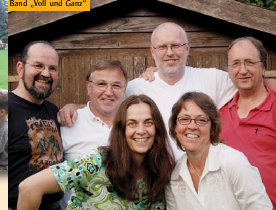
Band „Voll und Ganz“

Es grüßt Sie von ganzem Herzen der Vorstand der Lebensbrücke