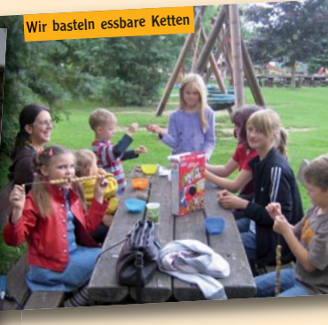
Wir basteln essbare Ketten