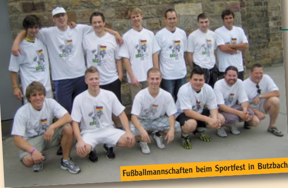
Fußballmannschaften beim Sportfest in Butzbach

Gestaltung: www.kreativ-agentur-zilly.de