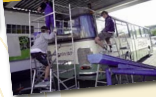
Restaurationsarbeiten an Projekt 58,7

Herrliches Sommerwetter ließ das Spielfest des Landeskindertrachtentreffens 2011, dem „Hessentag der kleinen Leute“, zu einer rundum gelungenen Veranstaltung werden. Gerne waren wir der Anfrage des Wetzlarer Jugendamtes nachgekommen, uns zusammen mit anderen Vereinen einzubringen, um die erwarteten ca. 800 Kinder und Jugendlichen aus ganz Hessen mit einem Spielfest in der Wetzlarer Colchester Anlage willkommen zu heißen. Viele Kinder kamen, um sich Projekt 58,7 von innen anzuschauen, und mehr als 200 bastelten brasilianische Freundschaftsarmbändchen und die „kleinste Spielesammlung der Welt“. Ein besonderes Geschenk war für uns alle das einstündige Freundschafts-