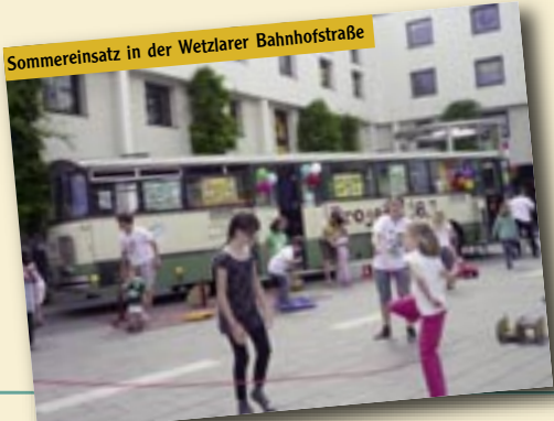
Sommereinsatz in der Wetzlarer Bahnhofstraße

An dieser Stelle ist es uns wichtig, einige unserer jungen Mitarbeiter zu Wort kommen zu lassen, um Ihnen zu berichten, welche wertvolle Erfahrungen sie in der vergangenen Zeit sammeln durften. Es ist für uns immer wieder erstaunlich, mitzuerleben, wie sich diese und auch andere junge Menschen dazu anstecken lassen, sich für solche einzusetzen, die ganz am Boden liegen –