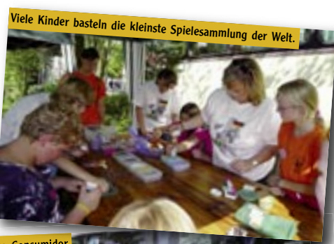
Viele Kinder basteln die kleinste Spielesammlung der Welt.

Um aber mit Projekt 58,7 in den Sommermonaten auf Tour gehen und die Türen auch am Weltkindertag auf dem Domplatz im Herzen Wetzlars für junge und ältere Menschen öffnen zu können, musste der Bus zuvor umfangreichen Reparatur- und Restaurationsarbeiten unterzogen werden. Dankbar waren wir für die fachmännisch handgefertigte Auspuffanlage, ohne die der Bus, der nächstes Jahr als „Oldtimer“ gilt, nicht mehr hätte zum Einsatz kommen können! Danach haben für einen Zeitraum von nahezu 3 Wochen unsere jungen Mitarbeiter ihre Freizeit investiert, um unter fachlicher Anleitung den vorhandenen Rost zu entfernen und anschließend die bearbeiteten Flächen zu grundieren und lackieren. Tragende Teile der Karosserie mussten herausgeschnitten und neue Träger und Bleche einschweißt werden. „Ich bin erstaunt und dankbar dafür, was ich in den letzten drei Wochen alles gelernt habe“ waren die Worte eines „ungelernten“ Helfers.