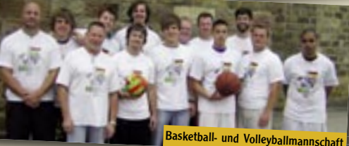
Basketball- und Volleyballmannschaft