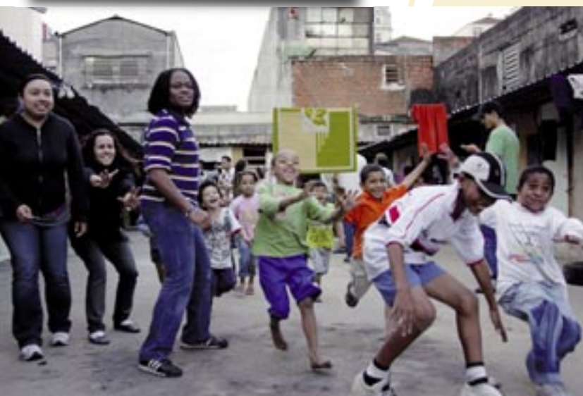
Obdachlose vor der CENA